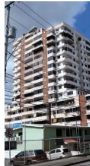
El Ejecutivo ordenó suspender cobro de alquileres.

Según el Miviot, se planteó que algunos arrendadores