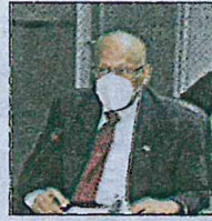
ML | Héctor Alexander, MEF.

ML | El ministro de Economía y Finanzas, Héctor Alexander, propuso ante la Asamblea Nacional disminuir el monto de los viáticos que reciben los funcionarios públicos cuando viajan en misiones oficiales, tanto a nivel nacional como internacional. Actualmente, el viático asignado por día para los altos funcionarios que viajen a Europa, Asia y Oceanía, en con-