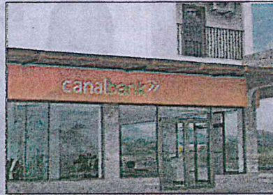
ML | Sucursal de Canal Bank en Penonomé.

En Gaceta Oficial del 19 de octubre de 2020, fueron publicadas las resoluciones que autorizan la acción a los bancos. Se trata de Scotiabank, Banco Delta, Bac Internacional Bank INC, Canal Bank S.A, Banistmo y Multibank. La SRP autorizó a The Bank Of Nova Scotia (Scotiabank) para el cierre del establecimiento