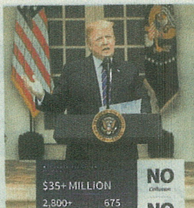
» Donald Trump, presidente de Estados Unidos.

"La última escalada podría dañar significativamente la confianza de las empresas y los mercados