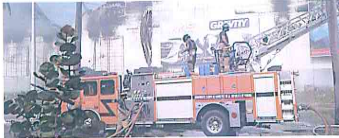
Personal de los bomberos que participó en la extinción del incendio en la Zona Libre de Colón.