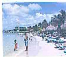
AFP | Turistas.

AFP | Las autoridades de República Dominicana celebraron ayer "un récord" en turismo, principal actividad del país, con casi 8,5 millones de visitantes en 2022, 37% más que el año anterior. El ministerio de Turismo anunció que 7,2 millones de personas viajaron por avión a destinos en esta nación caribeña entre enero y diciembre del año pasado, y que 1,3 millones llegaron por