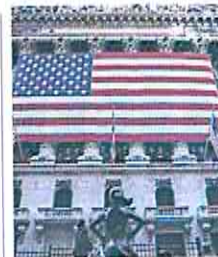
Bolsa de Nueva York.

de sus reservas de petróleo, que sumaron 19 millones de barriles adicionales. Un incremento excepcional debido al paro de actividad de refinerías en las últimas semanas, afectadas por una tormenta invernal que golpeó el país a finales de diciembre. Aunque un alza de una tal magnitud suele hacer bajar los precios del petróleo, no ocurrió en esta ocasión.