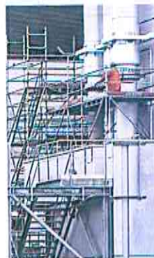
Una refinería.

80,10 dólares en Londres. El West Texas Intermediate (WTI) estadounidense, para entrega en febrero, subió 0,65% a 75,12 dólares. El gobierno chino publicó el lunes nuevas cuotas de importación de crudo para los refinadores, muy superiores a las de la primera tanda de autorizaciones para 2023, difundidas en octubre.