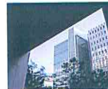
AFP | Banco Mundial.

AFP | El crecimiento económico mundial puede caer hasta quedar "peligrosamente cerca" de la recesión en 2023, advirtió ayer el Banco Mundial (BM) al recortar sus previsiones debido a la alta inflación, el aumento de las tasas de interés y la invasión rusa a Ucrania. Los economistas del organismo advierten sobre el riesgo de caída de la economía mundial, mientras los países luchan contra los costos