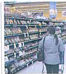
AFP | Consumidora.

AFP | La bolsa de Nueva York terminó al alza ayer en un mercado satisfecho por los datos de inflación de diciembre en Estados Unidos que mostraron una moderación del alza de precios. Así, el Dow Jones subió 0,64%, el tecnológico Nasdaq también 0,64% y el S&P 500 0,34%. La inflación a 12 meses en Estados Unidos alcanzó su menor nivel en un año en diciembre, según datos oficiales que señalan que lo peor de la escalada de precios podría haber pasado. El dato de diciembre mostró un incremento de 6,5% de los precios al consumo (índice CPI) el año pasado.