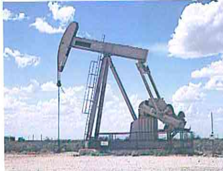
Una máquina utilizada para la extracción de petróleo.

entrega en marzo ganó 1,64% y cerró a 84,03 dólares en Londres. En tanto el barril de West Texas Intermediate (WTI) para entrega en febrero ganó 1,26% a 78,39 dólares en Nueva