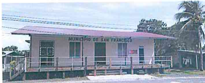
Predios del Municipio de San Francisco en la provincia de Veraguas.