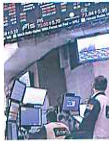
AFP | Bolsa de Nueva York.

AFP | La bolsa de Nueva York terminó al alza ayer, impulsada por subas en acciones que estuvieron a maltraer en los últimos meses, en una atmósfera positiva antes del dato de inflación para diciembre. El Dow Jones ganó así 0,80%, el tecnológico Nasdaq 1,76% y el S&P 500 1,28%, se informó.