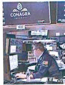
Bolsa de Nueva York.

ML | La bolsa de Nueva York terminó al alza este martes una jornada volátil, con los inversores en espera de un indicador de inflación ayer. El índice Dow Jones ganó 0,56%, el tecnológico Nasdaq 1,01% y el S&P 500 ganó 0,70%, de acuerdo a un informe divulgado.