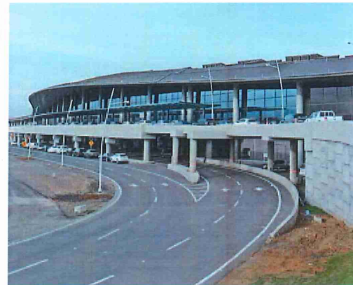
Nueva Terminal del Aeropuerto de Tocumen laborei.