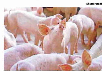
El consumo de cerdo en Panamá se ubica entre los más altos de América Latina y el Caribe.

"Somos una actividad con una logística de trabajo que