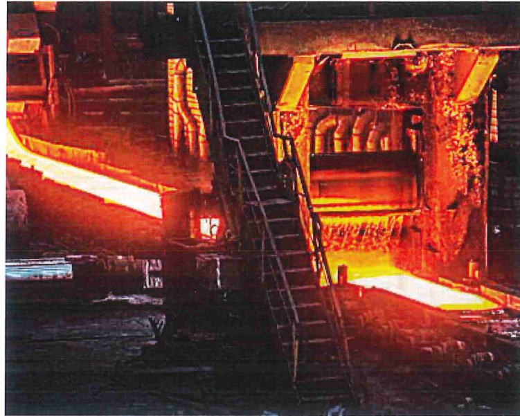
El cobre representa más del 50% del valor de las exportaciones chilenas hacia China.

Según el ITC, estas cifras se basan en el aumento que están teniendo las exportaciones de los países en desarrollo hacia China, que se han incrementado un 79% desde que inauguró el BRI, llegando