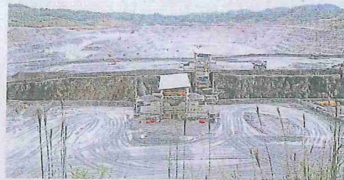
Uno de los desafíos que tiene el sector minero en Centroamérica es ser amigable con el ambiente.